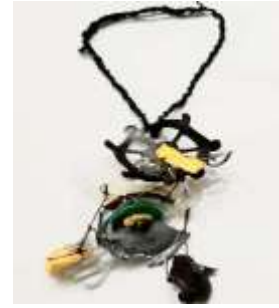
تجميع الحلي من الورشة التعليمية بمتفات من التراث السويسي ملحق (1)

(AmeSea Database – ae – July- 2021- 528)