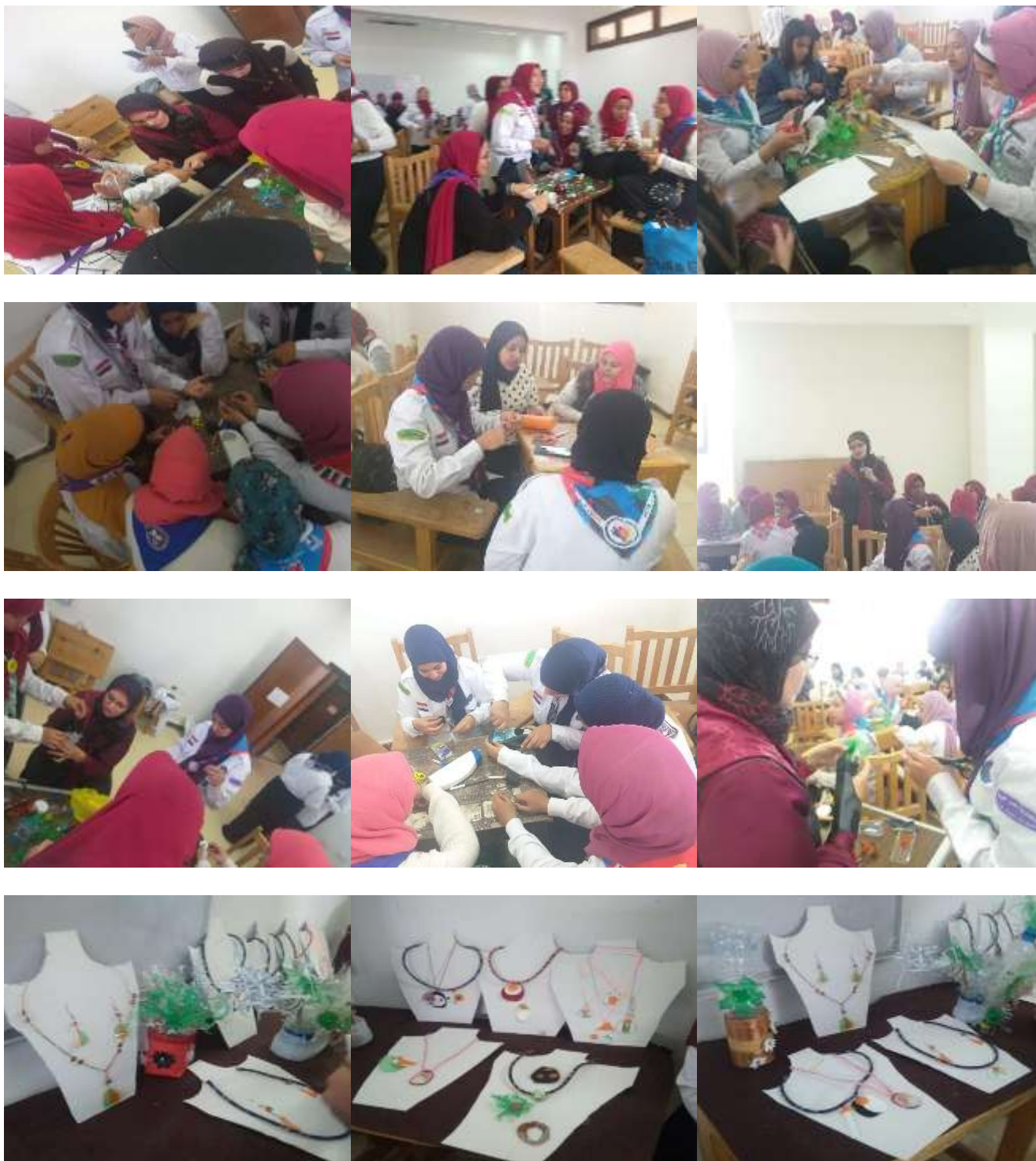
الورشة اليوم الثالث