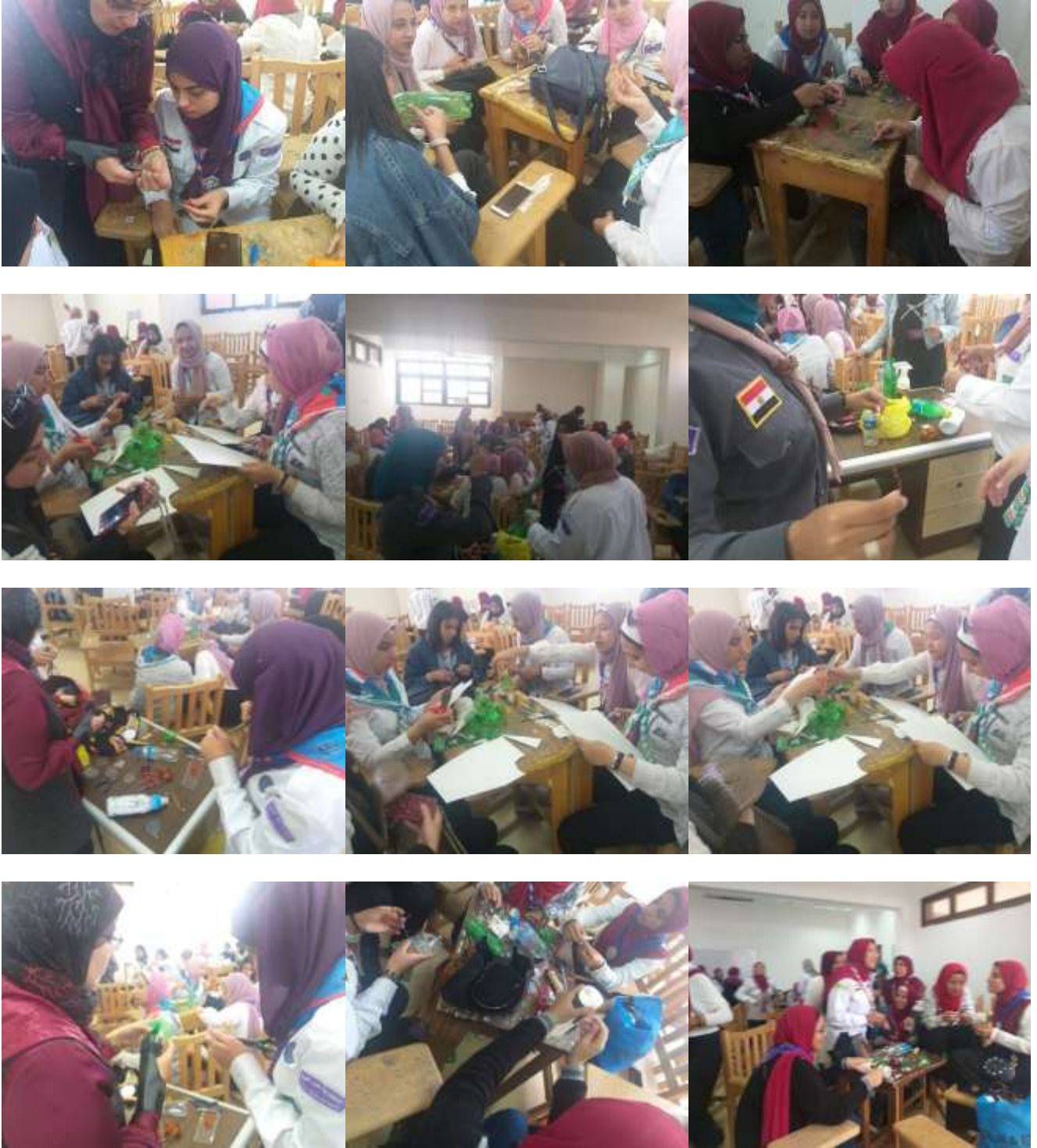
الورشة اليوم الثاني