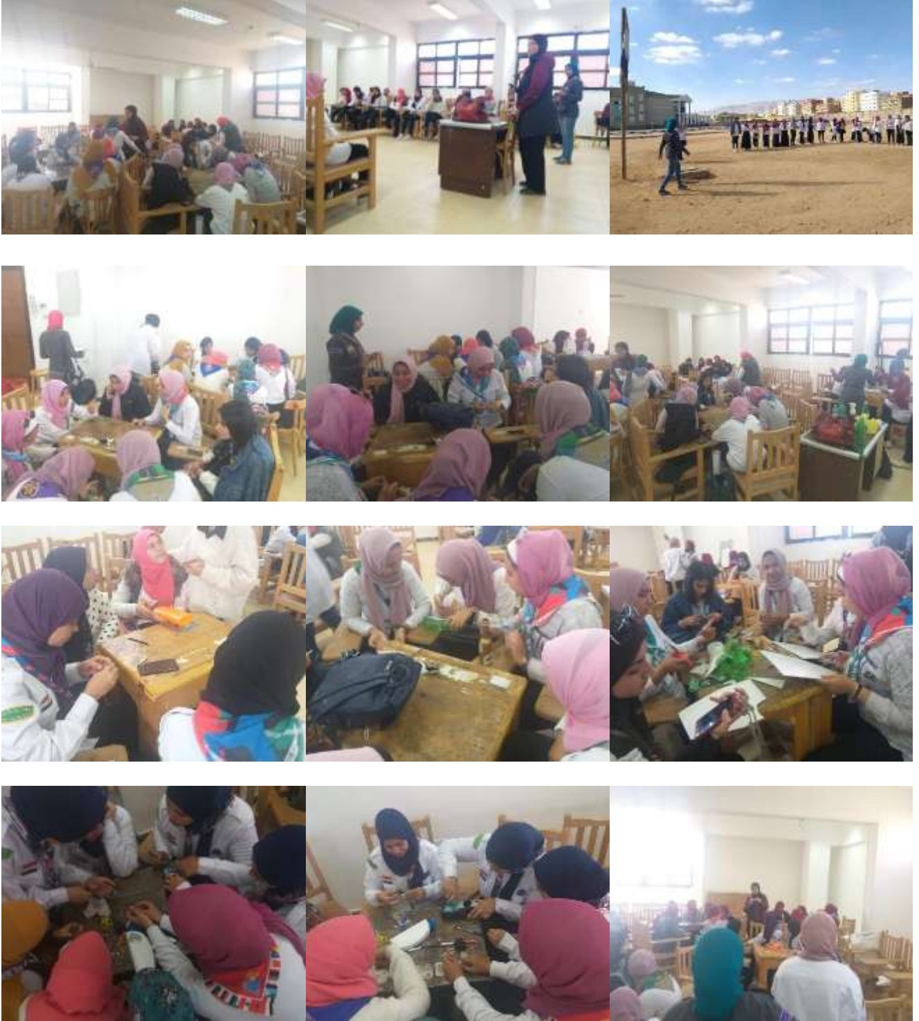
الورشة اليوم الأول